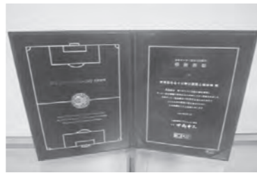
公益財団法人日本サッカー協会様より戴いた表彰状です。