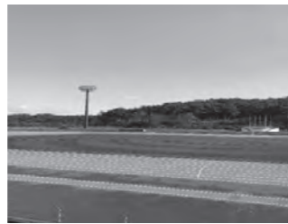
グリーンスタジアムしばた

五十公野公園陸上競技場「グリーンスタジアムしばた」は県内では2施設のみとなる、9レーンのブルートラックで、ナイター設備も完備しています。大会等が無ければ1名からでも使用することができます。芝生のフィールドは主にサッカーやラグビーの大会で使用されており、今年、公益財団法人日本サッカー協会様より表彰状を戴きました。