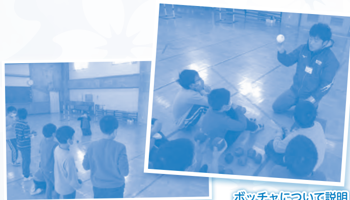
ポッチャについて説明

紫雲寺小学校特別支援クラスを対象としたポッチャ体験会が行われ、とらい夢職員を派遣しました。東京パラリンピックも近いことから、ポッチャ指導は大変人気があります。当日はパラスポーツの体験だけでなく、ニュースポーツも体験し、楽しい時間を過ごすことができました。