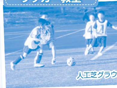
人工芝グラウンドでサッカー体験!