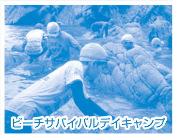
ビーチバレーボール体験キャンプ

年4回の体験のうち「第1回滝谷森林公園~加治川治水ダム」「第2回笹川流れ」で開催しました。四季を肌で感じながら大自然へ挑戦を通して生活に生きる気力と体力を養います。