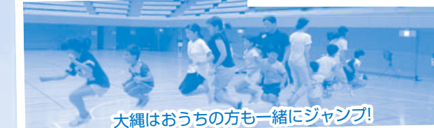
大縄はおうちの方も一緒にジャンプ!