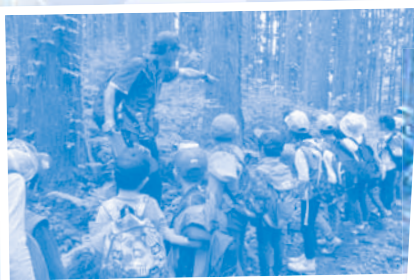
剣龍峡南部林道ハイキング

剣龍峡で野いちごをさがして食べたり、夜の五十公野山を歩いて虫を観察したりと子どもたちの知的好奇心を大いに育みます。