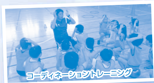
コーディネーショントレーニング

運動神経が著しく発達するといわれているプレゴールデンエイジ（5～9歳）を対象に、1年間通しているような運動・種目を体験する教室です。短期間で変化が出てくるお子さんも多く、多くの方から高い評価をいただいております。