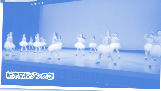
新津高校ダンス部