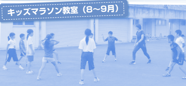
キッズマラソン教室 (8~9月)