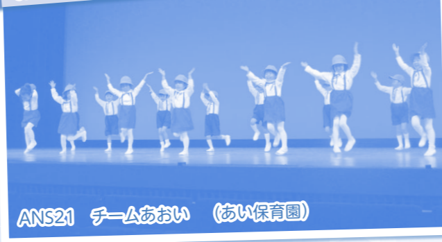
ANS21 チームあおい (あひ保育園)