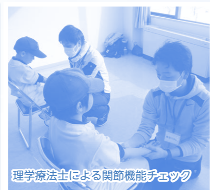
理学療法士による関節機能チェック