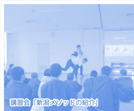
講習会「新潟メソッドの紹介」