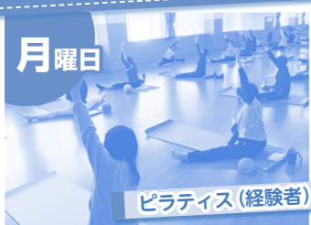
ピラティス(経験者)

とらい夢では、1週間の中で様々なスポーツ教室を開催しています。沢山の方々が参加され、健康増進や生きがいを感じる場にもなっている各種教室を紹介します！各教室活気のある雰囲気の中、笑顔で体を動かす姿が目立ちます。皆さんも楽しくチャレンジしてみませんか？