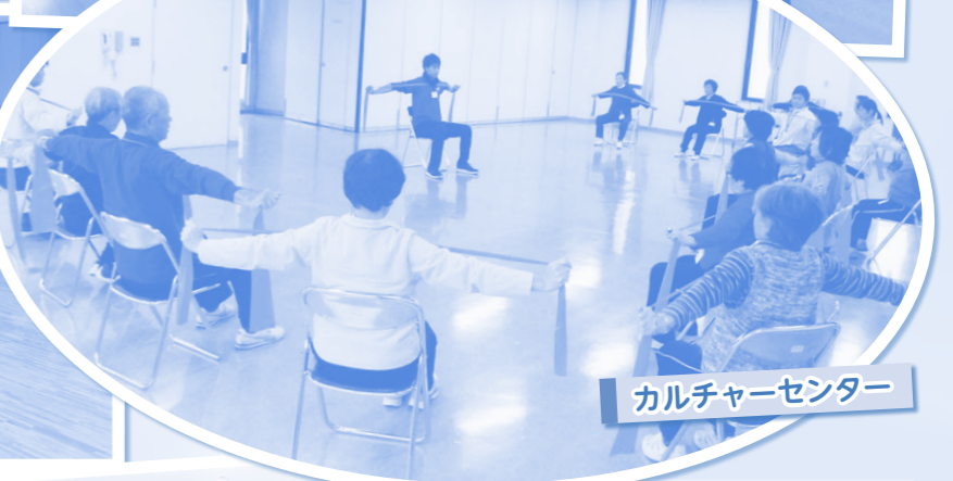
カルチャーセンター