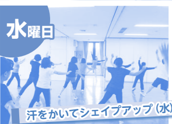
汗をかいてシェイプアップ(水)