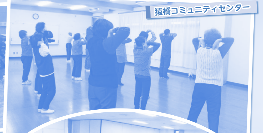
猿橋コミュニティセンター