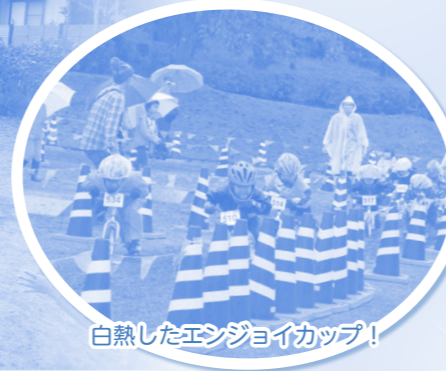
白熱したエンジョイカップ！