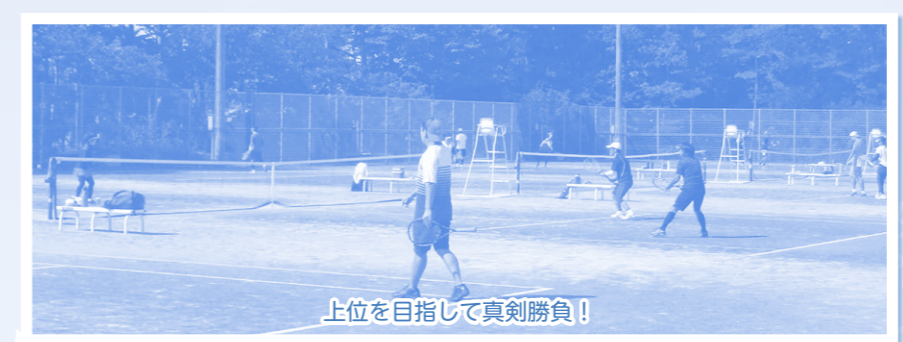
上位を目指して真剣勝負！

サンスポーツランドテニスコートにて、ミックスマックスダブルステニス大会を開催しました。新発田テニスクラブの協力のもと、当日は天候にも恵まれ、スムーズに大会が進行し白熱した好ゲームがいくつも見られました。