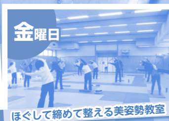
ほぐして締めて整える美姿勢教室