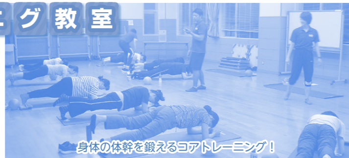
身体の体幹を鍛えるコアトレーニング！

運動を始めたいけど何をしたらいいのかわからない、トレーニングルームの使い方を教えてほしい、などの声から、サンビレッジしばたにて、運動初心者の女性を対象としたトレーニング教室を開催しました。全4回の短期教室でしたが、参加者からは「また参加したい」「期間を延ばして欲しい」などの声もあり、高い評価をいただきました。