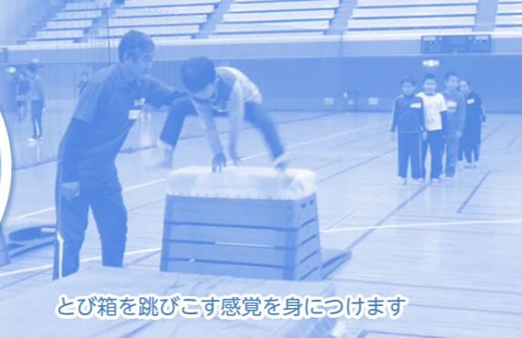
とび箱を跳びこす感覚を身につけます