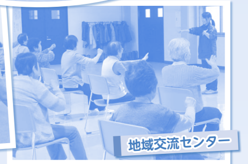
地域交流センター