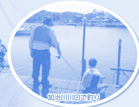
加治川川口で釣り