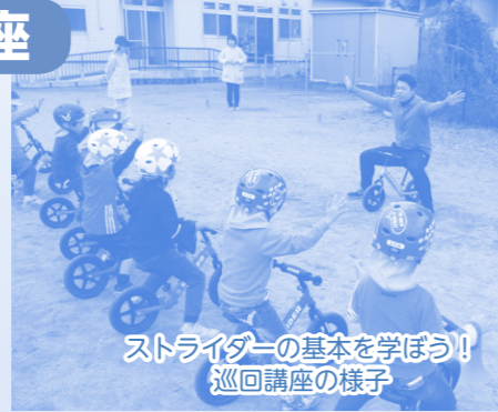
ストライダーの基本を学ぼう！ 巡回講座の様子

新発田市が市内の幼保・こども園を対象として行っているストライダー巡回講座に指導補助としてとらい夢職員がお手伝いしています。また、月岡カリオンパークで行われた2～5歳を対象として開かれたストライダーエンジョイカップにも従事スタッフとして、雨の中で濡れながらも一生懸命に競う子どもたちのサポートをさせていただきました。