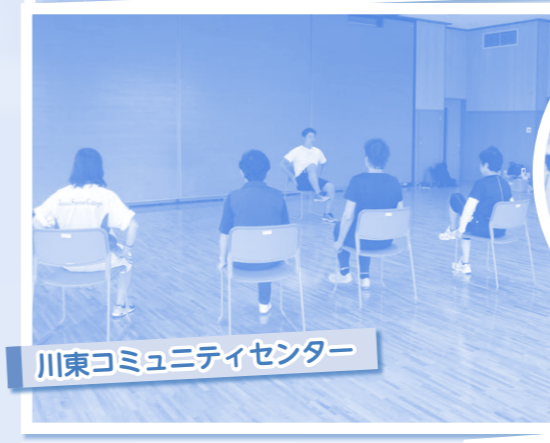
川東コミュニティセンター