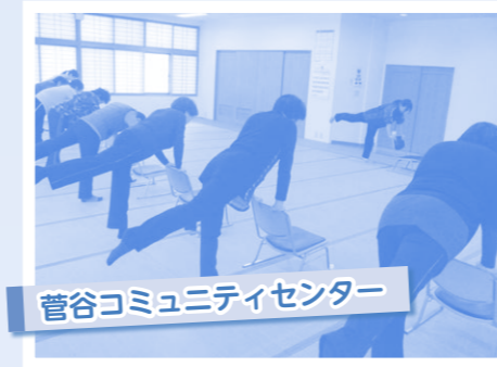
菅谷コミュニティセンター