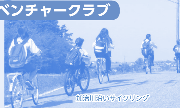
加治川沿いサイクリング

小学4・5年生が対象のアドベンチャークラブでは加治川に沿って海までサイクリングへ行き、川口で釣りをし、釣った魚をその場で揚げて食べるなど冒険活動を楽しみました。