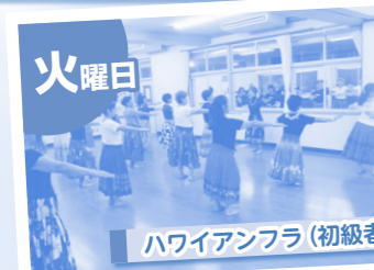
ハワイアンフラ(初級者)