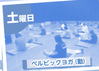
ペルビックヨガ(動)