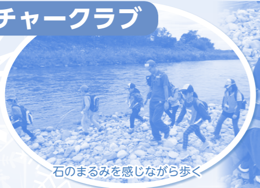
石のまるみを感じながら歩く

小学2・3年生が対象のネイチャークラブでは加治川の川原へ行き、石を観察したり、川原の石を拾って、焼き芋を焼いて食べるなど、秋の自然を満喫しました。