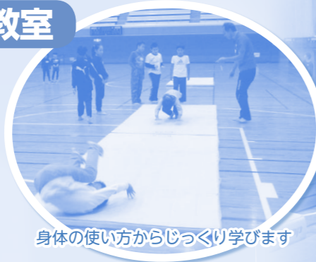
身体の使い方からじっくり学びます

市内の小学生を対象として全4回の短期集中教室を開催しました。マット・とび箱ともに基本的な技に挑戦し、苦手克服を目指す子どもレベルアップを図る子どもも、指導に対して真剣に耳を傾け、一生懸命に練習していました。