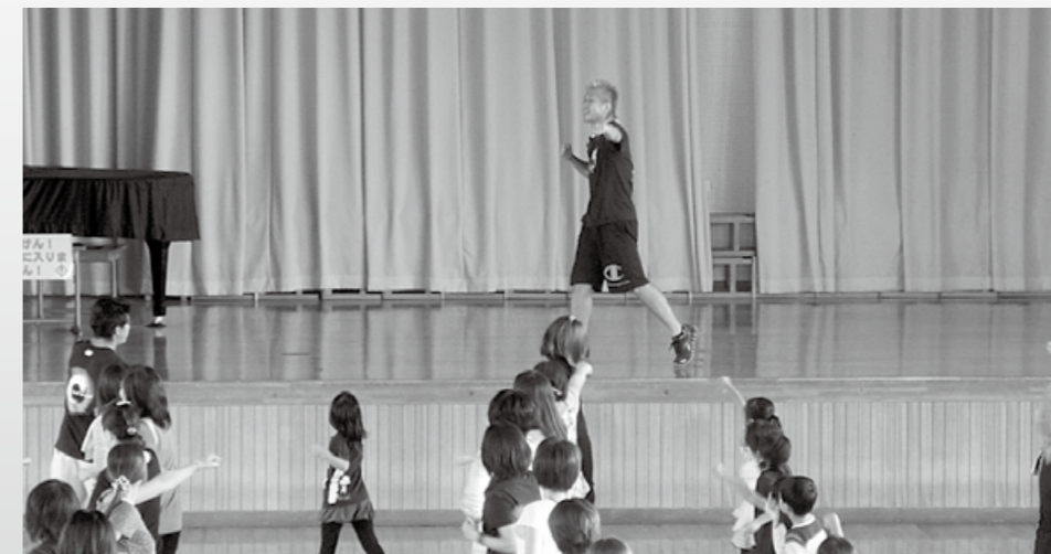
みんなで動いていい汗をかこう!!（おやこキックボクササイズ）