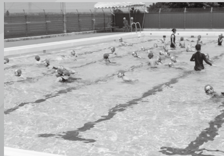
泳げるようになれば水も怖くない! (水泳)