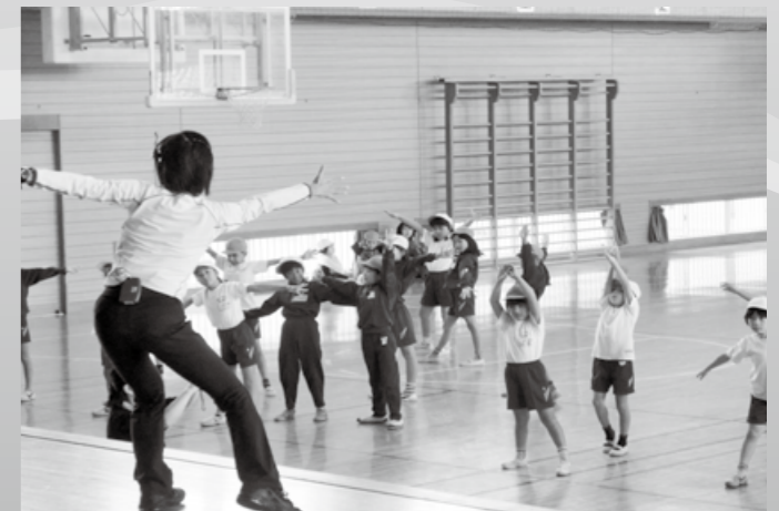
一緒に動くと楽しい！（おやこエアロビクス）