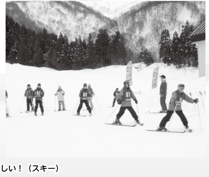
スキーって楽しい！（スキー）