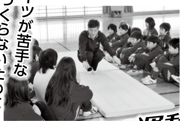
身体のつかい方が大事! (マット運動)