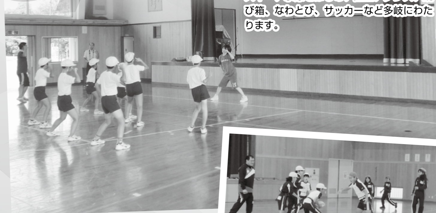
身体で表現してみよう! (ダンス)

平成26年度の学校派遣事業では、市内22校ある小学校のうち21校に120回以上講師を派遣いたしました。種目としては、スキー、水泳をはじめ、陸上、ダンス、跳び箱、なわとび、サッカーなど多岐にわたります。