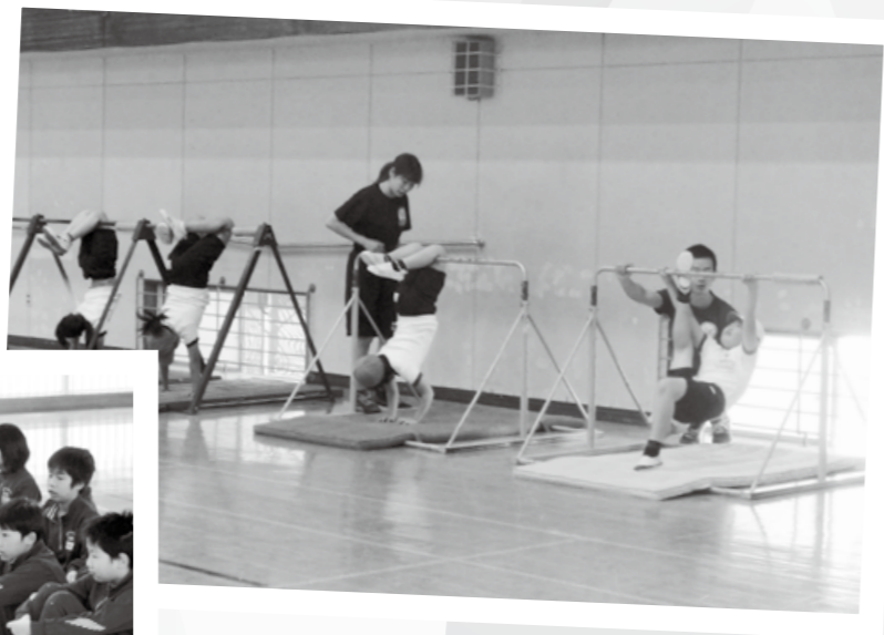
鉄棒は色々な筋肉を使います (鉄棒)