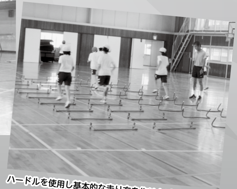
ハードルを使用し基本的な走り方を作り上げます (陸上)