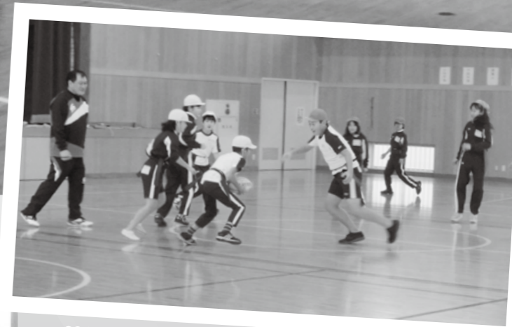
はじめてのスポーツはすごく楽しい! (タグラグビー)