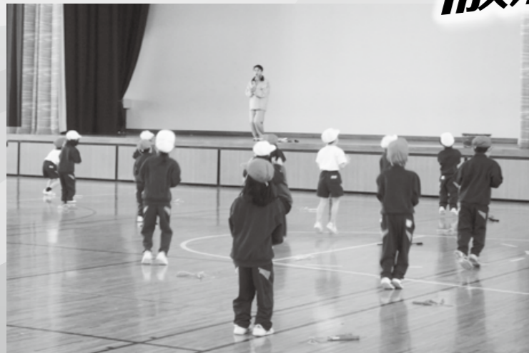
まずは、なわとびなしで飛び方の練習。跳ぶときの姿勢が大事 (なわとび)