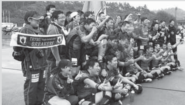
勝利を祝って記念写真