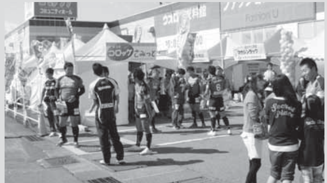
選手自ら告知活動を行いました。