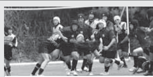
「中学生は、中学校ラグビー部と一緒に活動をしています。」

新発田ラグビースクールは、新発田地域におけるラグビーの底辺拡大を目指して活動しています。入校・体験は、随時受け付けています。日頃、運動不足のお父さん、お母さん、お子さんと一緒にラグビーボールを使って体を動かし、楽しいひと時を過ごしてみませんか。