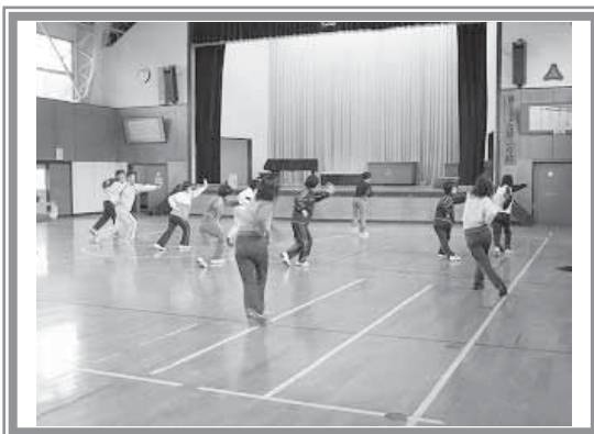
▲【実技講習】小学校の先生に体育授業、休み時間にできる体力づくり運動の講習です。