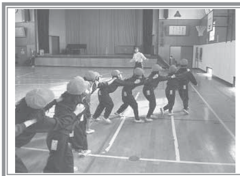
▲【体育表現】動きを真似したり、皆で協力し、ジェットコースターになりました。