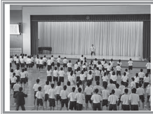
▲【ダンスを踊ろう】エアロビクスを楽しみました。