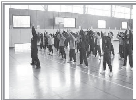
▲【よさこい】震災復興のために作られた『にいがた総踊り'05 神楽』です。