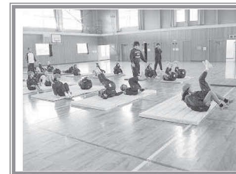
▲【マット運動】ゆりかごのように体を前後に揺らす練習をしてから技の練習です。