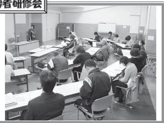
▲【スポーツの栄養学】スポーツ選手の栄養学をわかりやすく教えていただきました。