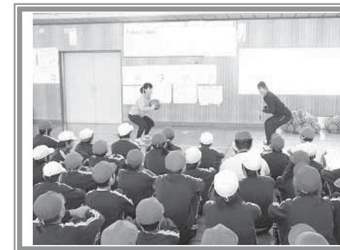
▲【バスケットボール】基本のフォームのお手本を先生たちが見せてくださいました。