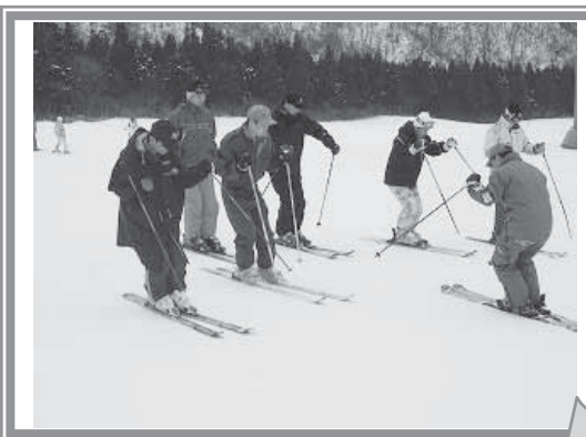
▲【学校スキー指導者講習】レベル別に分かれ指導方法を教えていただきました。