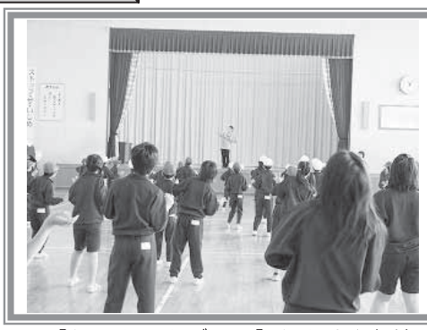
▲【トッキキダンス】トキめき新潟国体開催に向けて、製作されたダンスを教えていただきました。