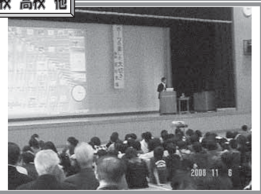
▲【スポーツ講演会】『スポーツの楽しさ・大切さ』についてお話をいただきました。