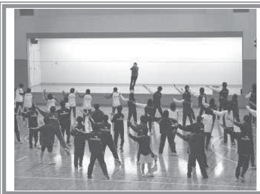
▲【アスリートエアロ】冬の間、活動できない高校の運動部向けのエアロビクスです。