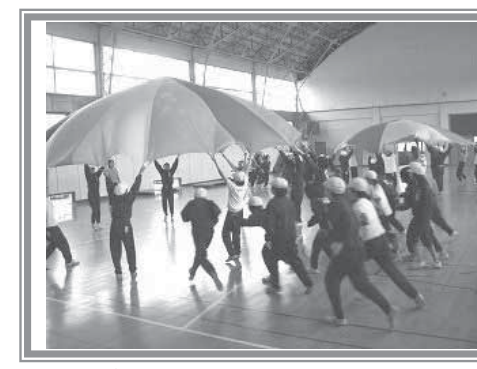
▲【パラシュート】準備運動でエアロビクスをして、スキンシップ遊び、パラシュートを使って楽しく遊びました。